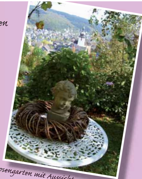
Rosengarten mit Aussicht